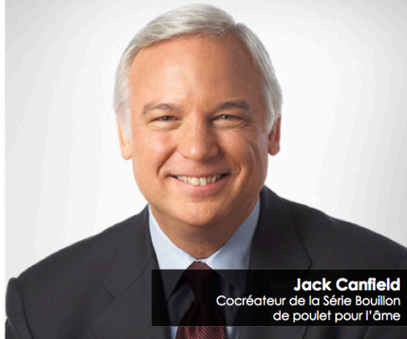
Jack Canfield Cocréateur de la Série Bouillon de poulet pour l'âme